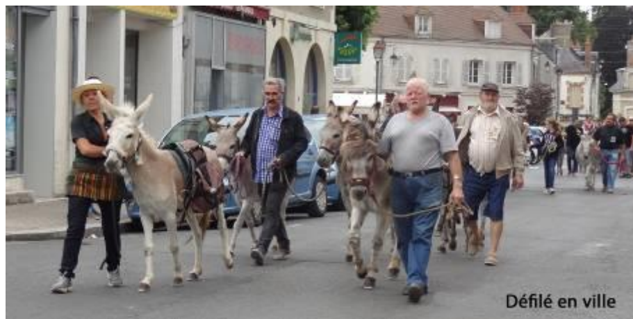
Défilé en ville