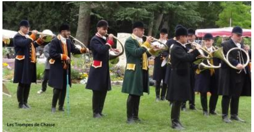
Les Trompes de Chasse