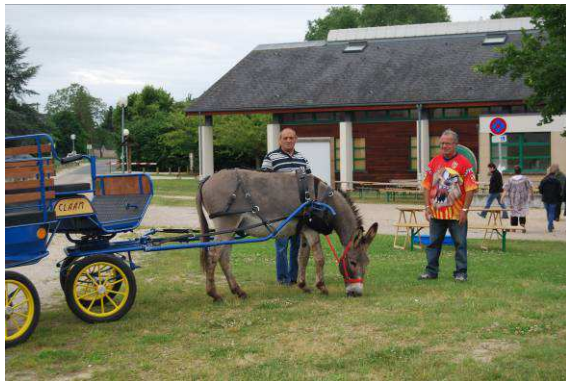
Boigny le 24 juin