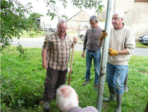
Pose d'une nouvelle barrière