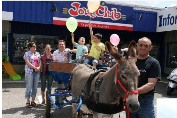
Pour Jouet Club le 23 juin