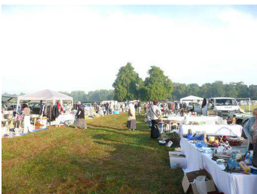
Notre vide grenier du 2 septembre, avec une météo clémentine, a été un succès avec 172 exposants.