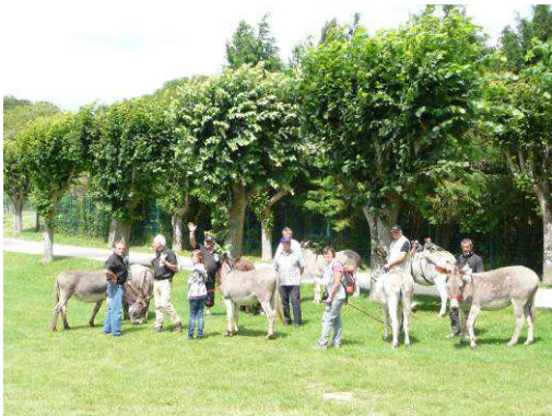
Ballade dans le parc le 19 juillet