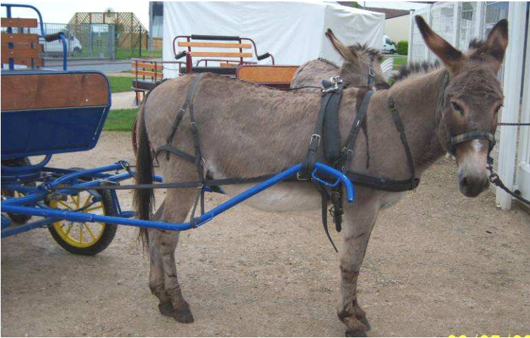
NOYAU et KAMILLE.