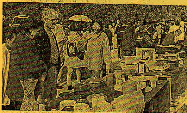
Plus de 200 exposants proposaient des marchandises variées.

Dimanche, le vide-greniers du Club Ligérien des Amis de l'âne et du mulet a attiré des milliers de visiteurs. Passé la fraîcheur matinale, ils ont investi la promenade de l'Herbe Verte.