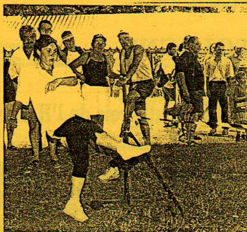
Les nombreux badauds ont pu jouer à de nombreux jeux comme le lancer de mules.

Des visiteurs par milliers, une chaleur écrasante, tel est le bilan de la cinquième édition de la fête annuelle du club des amis de l'âne et du mulet.