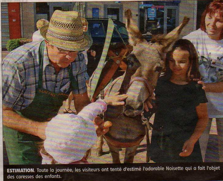
ESTIMATION. Toute la journée, les visiteurs ont tenté d'estimer l'adorable Noisette qui a fait l'objet des caresses des enfants.