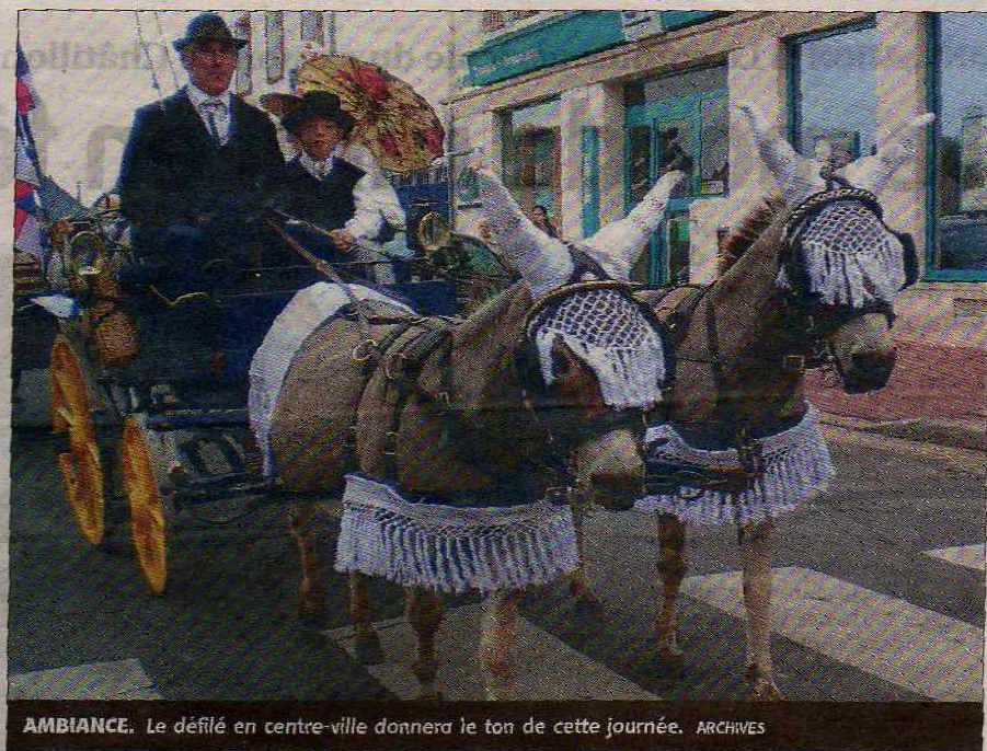
AMBIANCE. Le défilé en centre-ville donnera le ton de cette journée.

L'an passé, la manifestation avait attiré près de 10.000 visiteurs. Organisée par le Club ligérien des amis de l'âne et du mulet (Claam), la fête de l'âne est en passe de réussir son objectif, comme l'explique