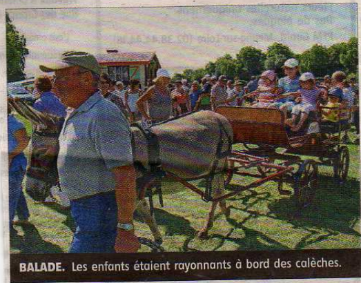
BALADE. Les enfants étaient rayonnants à bord des calèches.

Les personnes pourront également les retrouver ainsi que des photos et vidéos de cette belle journée sur le site www.claam.fr ■