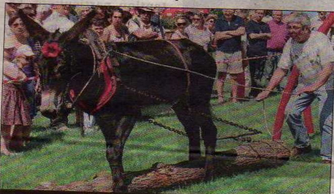
ÂNE DE TRAVAIL. La démonstration de débardage a impressionné le public.

Dimanche dernier, la fête de l'âne a vu passer près de 12.000 visiteurs. Un grand succès qu'elle doit à ses animations familiales autour d'un animal très attachant qui, cette année encore, a fait le bonheur des enfants.