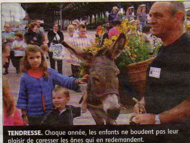
TENDRESSE. Chaque année, les enfants ne boudent pas leur plaisir de caresser les ânes qui en redemandent.

Ce sera l'occasion de découvrir notamment l'âne commun, du Cotentin, du Berry et du Poitou. Les enfants ne manqueront pas